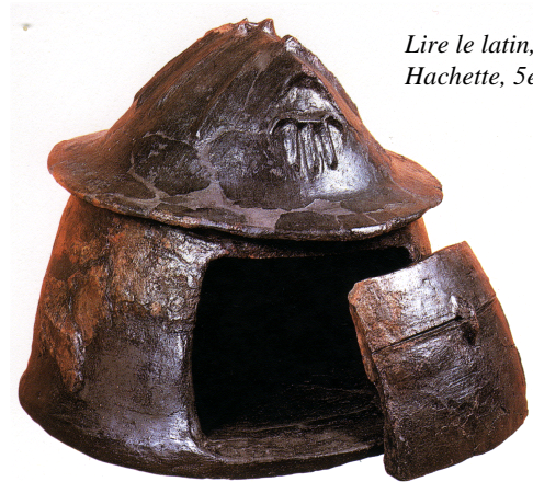
Lire le latin, Hachette, 5e